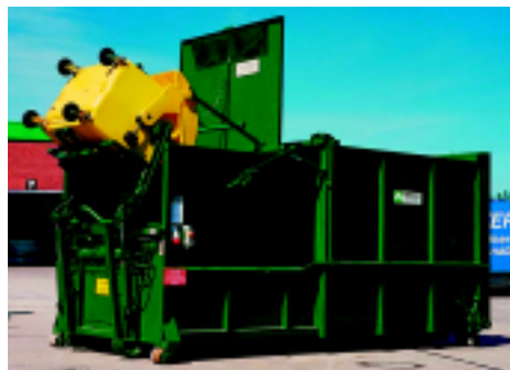
Avermann MPC-12 s DIN podigačem za kante i kontejnere