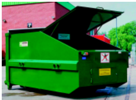
Avermann MPC-5 presscontainer s integriranom prešom