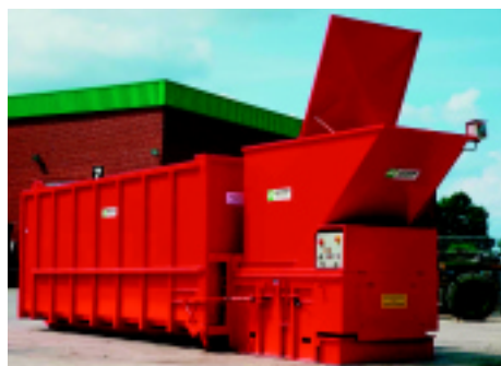
Avermann SP-12 odvojiva preša i 32m 3 roll kontejner