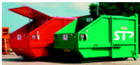
Avermann MPC-10 hrvatski bestseller copy

Vjerojatno se pitate: "... zar to nije isto?" Iako je razlika na prvi pogled vrlo mala, radi se o vrlo bitnim stvarima. Što znači iskustvo, najbolje će Vam definirati stariji ljudi koji vrlo često kažu: "... e da sad imam ovu pamet i one godine..." Dakle, znamo što znači iskustvo! Avermann-ovi uređaji za sabijanje otpada posjeduju gotovo sve certifikate koji potvrđuju kvalitetu, među inim i ISO 9001 koji je kod nas vrlo popularan, no ti se uređaji proizvode već gotovo 40 godina!!! Iako su na našem tržištu veliko čudo, ta je tehnika pohrane otpada u Europi već dobro znana i isprobana.