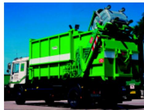
Avermann MPC-16 presscontainer s priključcima za rad na Abrollkipper-u i DIN podigačem

Nadam se da će Vam ovih pet točaka pomoći pri odabiru i nabavi. Naše je tržište na žalost takvo te bi se čovjek prije nego bilo što kupi, prvo trebao raspitati o vjeku trajanja, garancijama, servisu, rezervnim dijelovima, potvrđama onoga što stoji u deklaracijama. Da bi se postigla što niža cijena (vrlo bitno na javnim nadmetanjima), često se štedi na materijalu i njegovoj kvaliteti. Kupiti original ili nešto što liči na original nije isto. Prva stvar po kojoj se to može vidjeti najčešće je cijena.